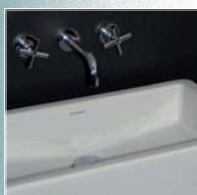
Loza y grifería